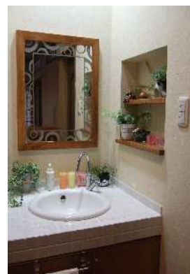
昨年度受賞作品 「お気に入りの場所」