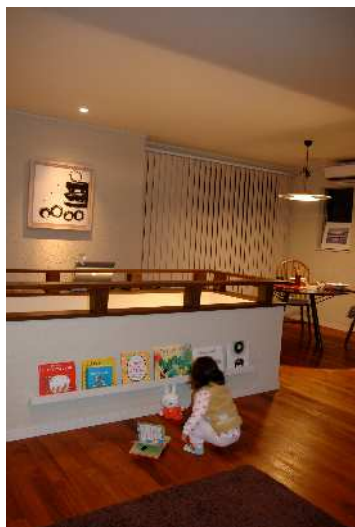
昨年度グランプリ受賞作品 「小さな図書館」