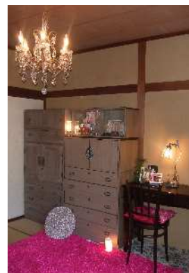
昨年度受賞作品 「RELIGION BLOOM」